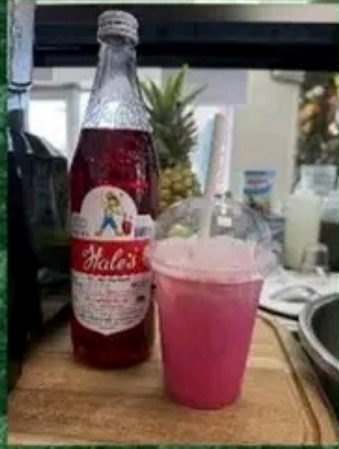
Sirup de Sula