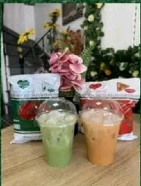
Thé thaïlandais rouge & vert