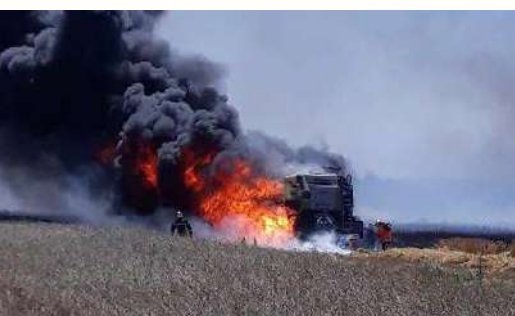
Feu de poussières accumulées à certains endroits