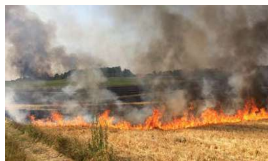
Feu de chaumes au contact de surfaces chaudes ou de friction avec des pierres