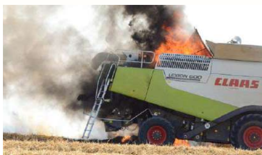
Feu de courroies échauffées sur des roulements coincés