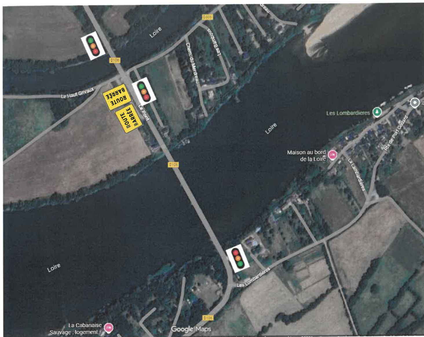
SCHÉMA DE LA SIGNALISATION ÉLARGIE