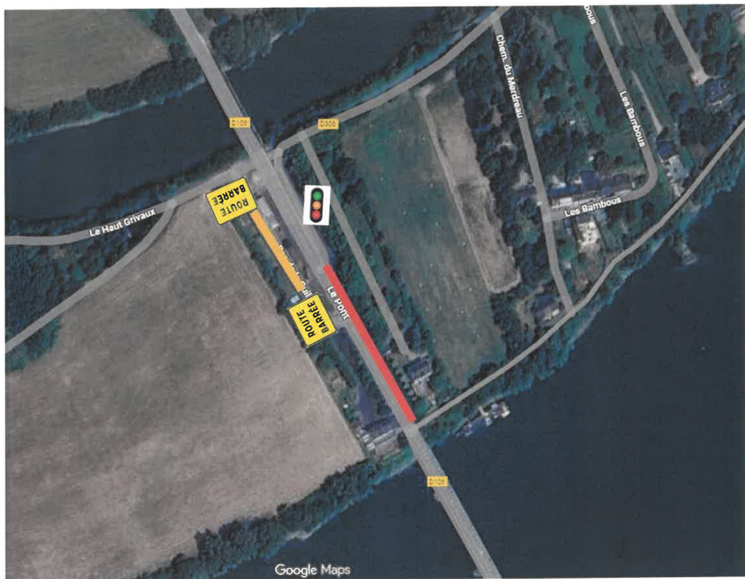
SCHÉMA DE LA SIGNALISATION AU DROIT DES TRAVAUX