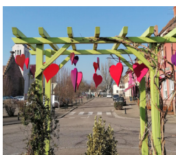
Parvis de l'église catholique 4 Rue Albert Schweitzer à Ostheim