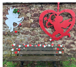
Le banc de la Fontaine Sainte Hune à Hunawihr