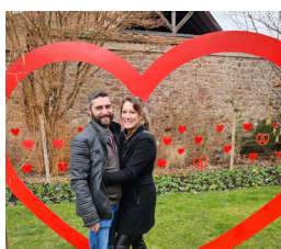
Jardin de la mairie Place Walter à Bergheim