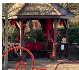
La Gloriette Tour du Ladhof à Guémars