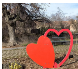
Parvis de l'église Protestante 2 Rue Albert Schweitzer à Ostheim