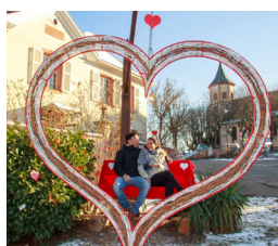
Le puits à bascule 2 rue du vignoble à Zellenberg