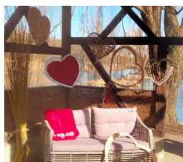
Pont de l'Ille Rue de l'Ille à Illhaeusern