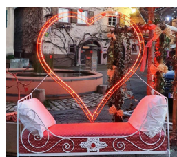
Le lit des amoureux Place du 19 décembre à Zellenberg