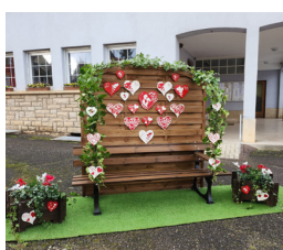
Le banc des amoureux Route du vin à Mittelwihr