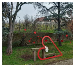
Lieu-dit Torrebrun à Saint-Hippolyte