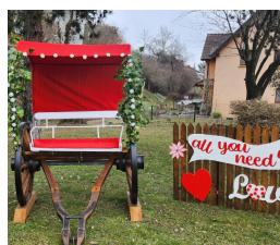
Le pousse-pousse des amoureux à Mittelwihr