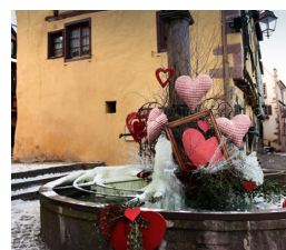
Cour des bergers Rue des remparts à Riquewihr