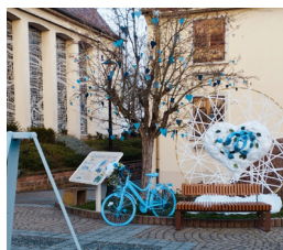
Fontaine Sainte-Odile à Bennwihr

Postez vos photos avec le #loveribeauvilleriquewihr sur Facebook pour tenter de gagner un Day Spa + Collation pour deux personnes ou sur Instagram pour avoir une chance de remporter 2x deux bons « Journée balnéo » au Resort Barrière de Ribeauvillé !