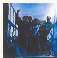
Et une armée de bénévole à vélo !

Contact presse : Silvain De Brouwer / 0643624375 / debrouwer.silvain24@gmail.com