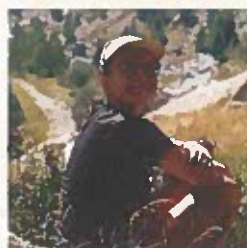
Cléo Pierre Logistique