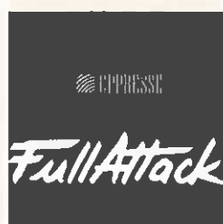
Structure soutien / Réseaux sociaux