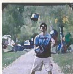
Mathieu Goron Logistique