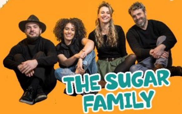
THE SUGAR FAMILY