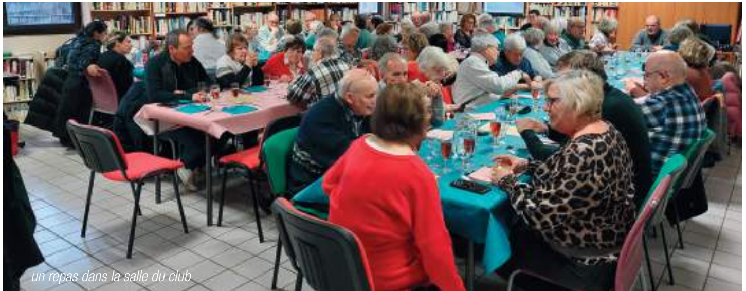
un repas dans la salle du club