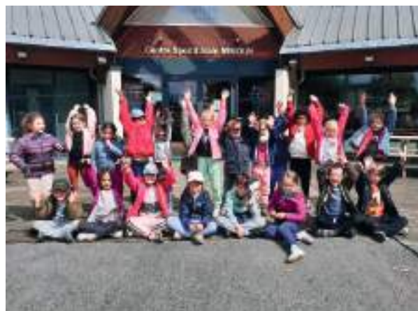
Mon 1 er séjour USEP à Bugeat Classe de CP (mai 2025)