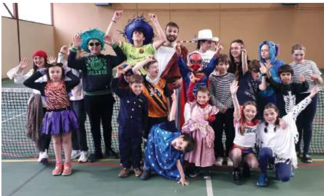
Carnaval de l'école de tennis