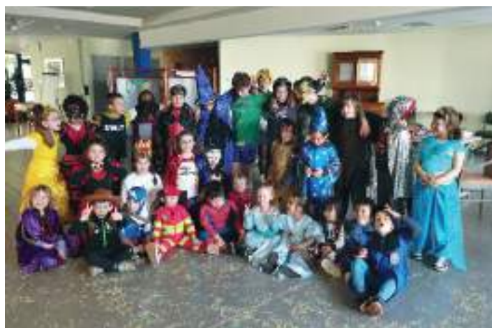
Carnaval 2025 (créatif pour le premier et à l'EHPAD pour le second)