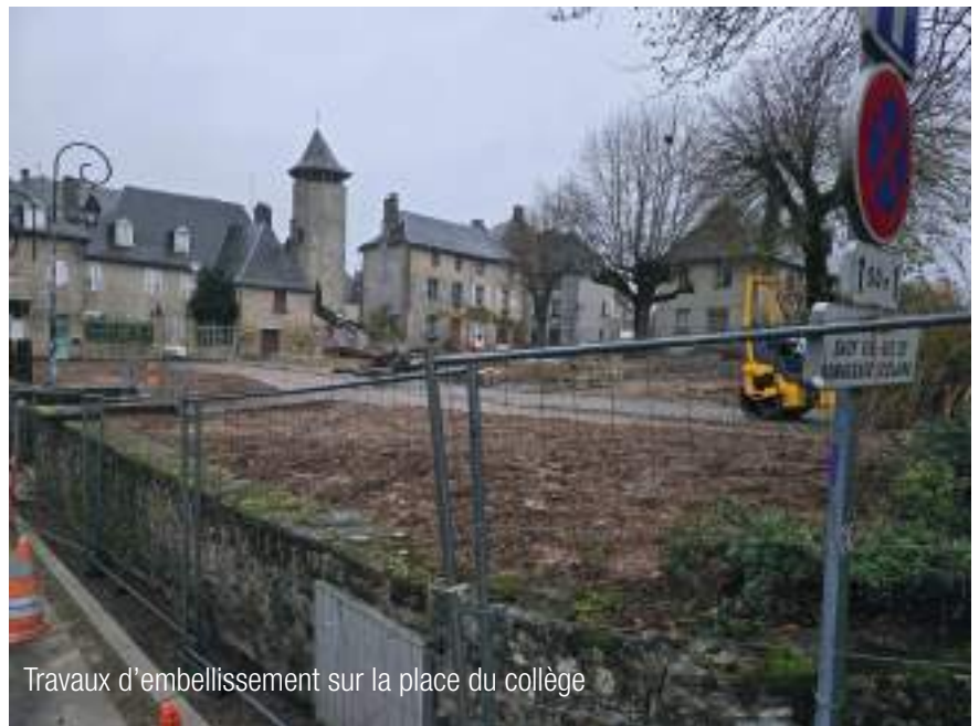
Travaux d'embellissement sur la place du collège

C'est ainsi que plusieurs « langages » noble, sobre ou courant pourront être déclinés en fonction de l'importance des places et rues majeures entraînant l'usage de la pierre plus ou moins enherbée, de revêtements poreux, des plantations, du mobilier urbain homogène. Cette approche menée en concertation avec nos interlocuteurs et partenaires sur le territoire, PNR, ABF, Département, se doit d'être totalement en cohérence avec nos règles d'urbanisme et la marque Petites cités de caractère qui nous a été attribuée une seconde fois pour cinq ans en 2023.