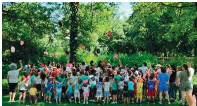
Sortie de l'école à Gramat (juin 2025)