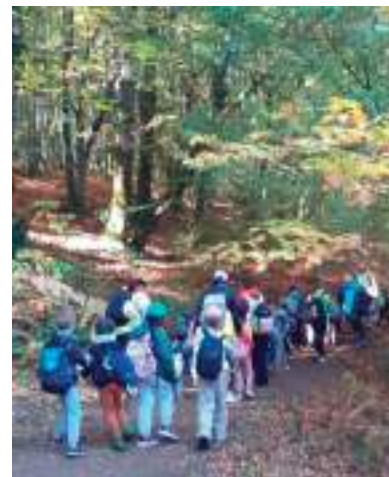
Randonnée à Chamberet (10/25)