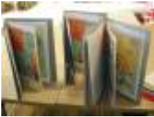
Des livres faits main, par les enfants des activités périscolaires de Treignac, grâce à la plasticienne Liliane Guedon-Rouillon

Vous trouverez dans nos rayonnages des livres pour tous les âges et tous les goûts : albums jeunesse, romans, policiers, livres régionaux. Au total, le catalogue de la médiathèque intercommunale compte 17 000 références. Les documents localisés à Chamberet, Tarnac ou Bugeat peuvent être acheminés à Treignac à la demande de nos adhérents.