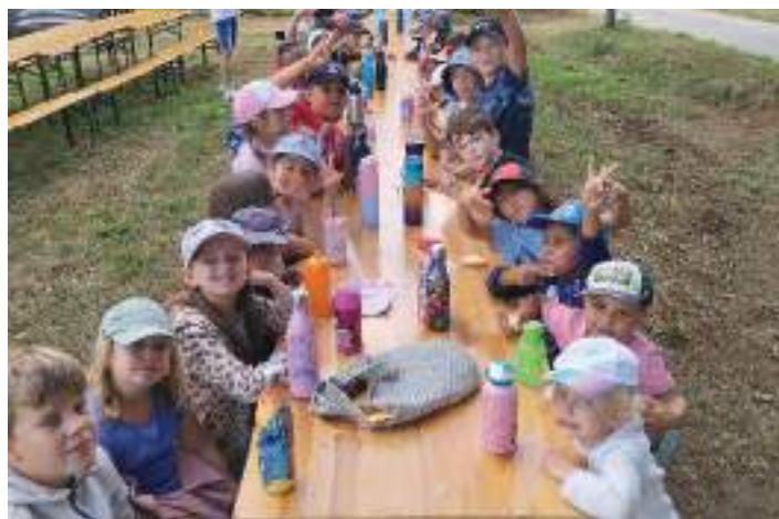
Camping à la ferme