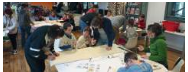
Pendant les vacances scolaires, les ateliers font le bonheur des familles

Nous travaillons avec des intervenants artistiques dans des domaines variés : arts plastiques, contes, éveil musical.