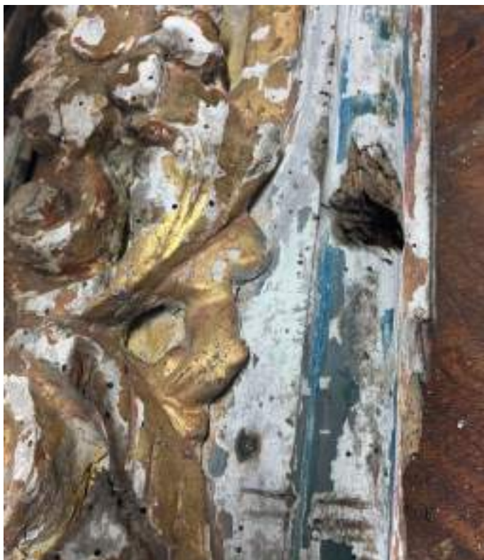
Un aspect du cadre du « Baptême du Christ » encore en cours de restauration

Nous n'attendons plus désormais que le retour du cadre du « Baptême du Christ » replacé dans la chapelle en octobre 2024. Très endommagé cet élément nécessite un gros travail de restauration et devrait être remis en place dans le courant de l'année 2026 Pour rappel le total des dépenses (tableaux, entretien et traitement de l'humidité) s'élève aujourd'hui à près de 80000€, avec des aides du Conseil départemental à hauteur de 17 391€, une aide du Crédit agricole de 10000€, une campagne de financement participatif et un vide dressing organisés par l'équipe municipale ayant permis de récolter environ 20000€, le reste à charge pour la commune est de plus de 30000 euros.