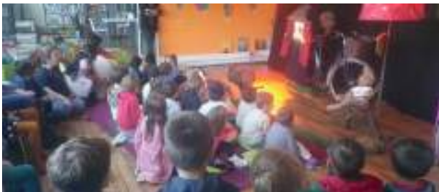
Des élèves de l'école de Treignac, captivés par le spectacle "Raya et Choko"

Accueils réguliers pour des lectures et des chansons, projets sur-mesure en fonction des attentes des enseignantes : la médiathèque est un outil éducatif au service des élèves scolarisés à Treignac.