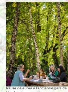
Pause déjeuner à l'ancienne gare de Marthon