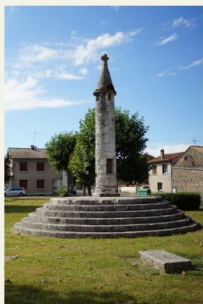
Pranzac, la lanterne des morts