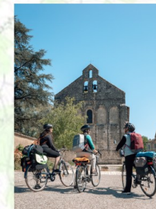
Feuilleade, l'église Saint-Pierre