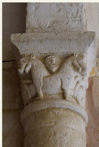
Bunzac, église Saint-Symphorien