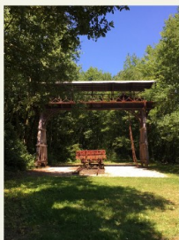
Chazelles, le portique de l'ancienne gare