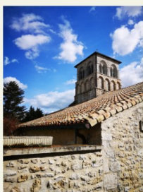
Saint-Germain-de-Montbron, l'église Saint-Germain