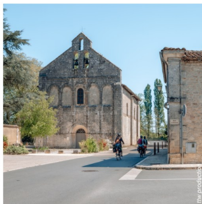
L'église Saint-Pierre de Feuillade