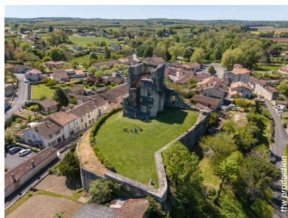
Le bourg de Marthon, au centre, la Tour du Breuil