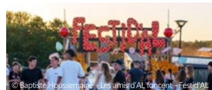
© Baptiste Houssemaine - Les amis d'AL foncent - Festid'AL