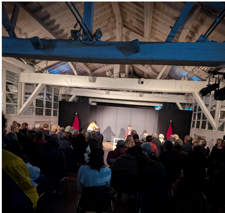
Spectacle « Poing de rupture »