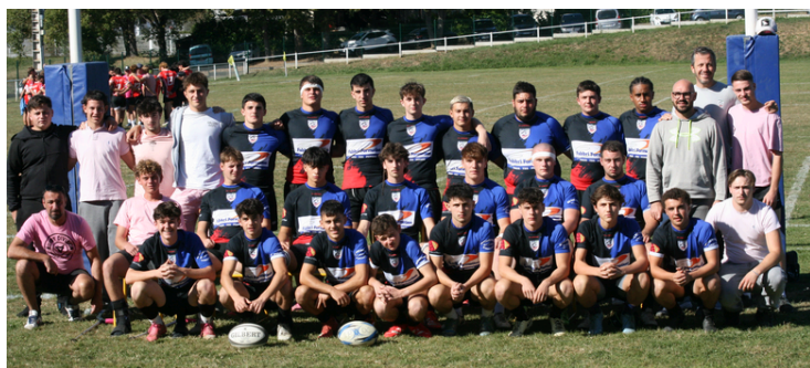
Les équipes Cadets et Juniors des Portes du Comminges