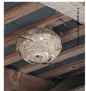
Frelon asiatique - Yamile Garcia