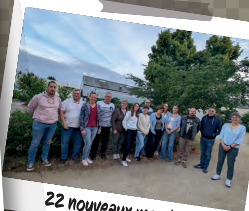
22 nouveaux membres