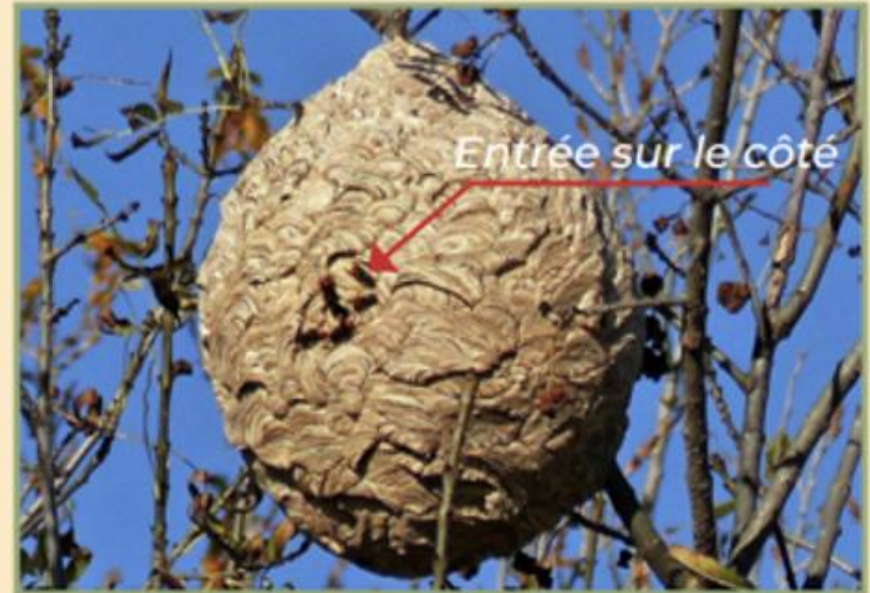
Entrée sur le côté

La colonie issue du nid primaire, à partir de fin mai, migre dans un nid secondaire situé dans les arbres à plus de 10 m de hauteur. Exceptionnellement il peut s'installer à hauteur d'homme (haies, plaque d'égout). La taille du nid peut atteindre 1 m de diamètre et peut alors contenir plus de 2000 individus.