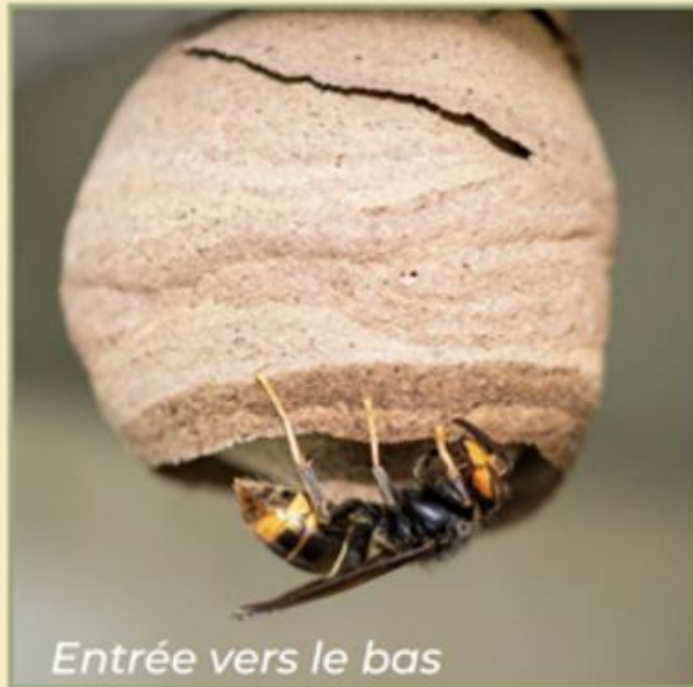
Entrée vers le bas

Entre mars et mai, dans un endroit abrité, la fondatrice construit et s'occupe des larves seule dans un nid gros comme une orange.