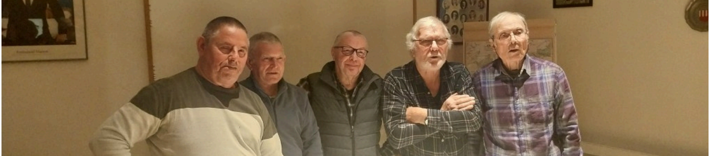
Photo des anciens et nouveaux responsables des Associations de pêche d'Avilley