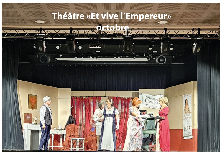
Théâtre «Et vive l'Empereur» octobre