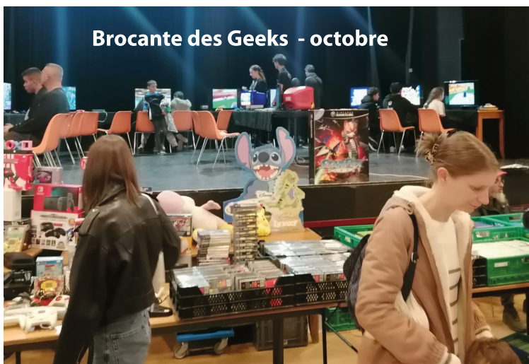
Brocante des Geeks - octobre