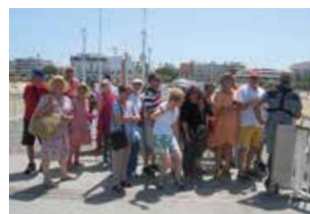
Excursion en bateau sur le Bassin d'Arcachon.