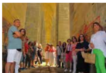
À Cubzac les Ponts.

Nous garderons en souvenir les sorties quotidiennes (photos ci-contre) que nous leur avons proposées durant ses 8 jours et au fond de notre cœur, tant de partage et d'amitié... ■