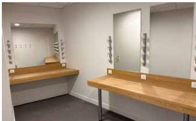
Les loges dédiées aux artistes.

animations de la médiathèque ou de l'association Artemuse, sans oublier les spectacles scolaires, rythment déjà la vie locale.