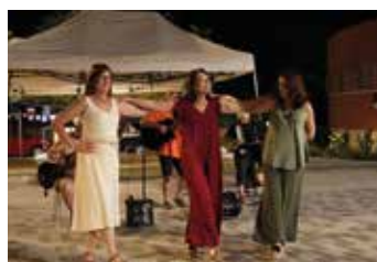
Danse crétoise lors de la soirée de gala.