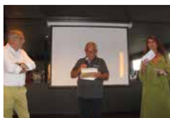
Soirée officielle de la municipalité à la Maison du Fleuve et remise de cadeaux.