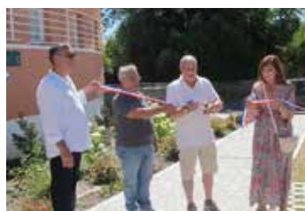
Inauguration de la signalétique sur la Place des Jumelages.