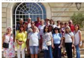
Visite du château Duplessis à Cénac.