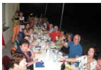
Soirée auberge espagnole.