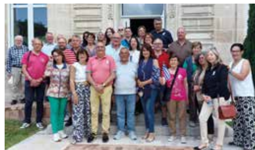
Accueil à la mairie avec les élus.

En 2012, nos jeunes camblanais ont été accueillis à leur tour, à Vori.