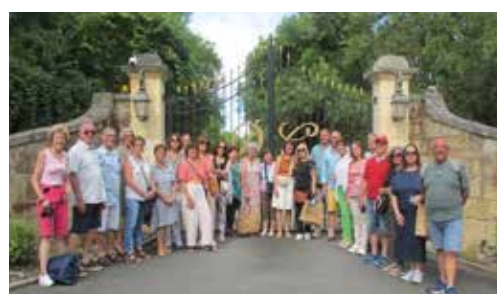
Visite des caves Café de Paris et Pont Eiffel à Cubzac les Ponts.