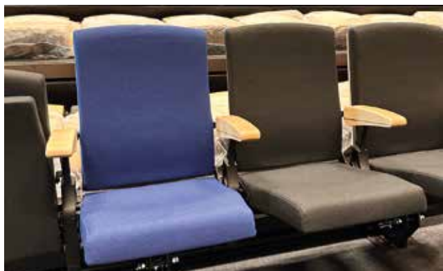
Les fauteuils, faisant partie des gradins rétractables, sont repliables et particulièrement confortables.