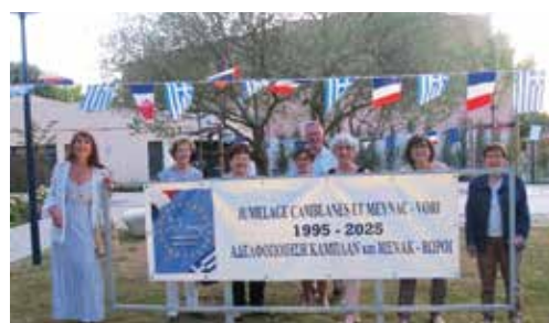
Premier jour à Camblanes et Meynac, visite de la commune.