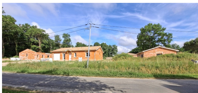
Le lotissement Hameau de Biouleau