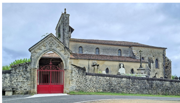
Le nouveau portail du cimetière