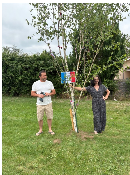
et aux agents municipaux