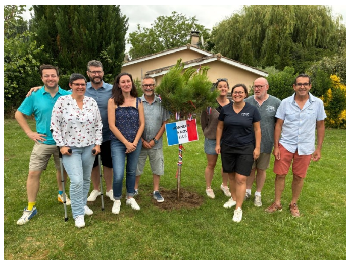
La maïade en honneur aux élus . . .