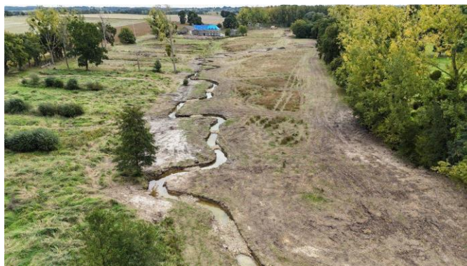
Figure 1 : Remise en fond de vallée du Guyoult et restauration de ses habitats

Au total sur le territoire, ce sont près de 100 sites qui ont été identifiés (avec des enjeux de ruissellement ou d'érosion) par la collectivité au cours des trois dernières années.