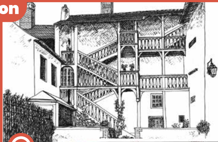
2S30, Archives municipales d'Auxonne (en noir et blanc le dessin sur calque, en couleurs le dessin aquarellé final) L'escalier représenté se situe sur la place d'Armes

La mairie d'Auxonne remercie encore Madame Dubuisson pour ce magnifique don.