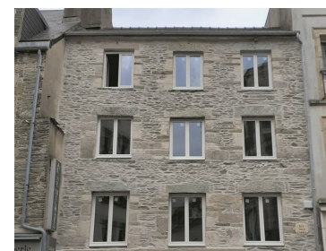
Réhabilitation globale : avant/après