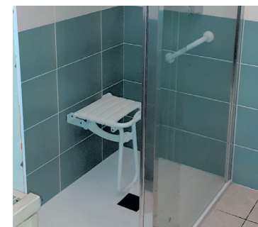
Adaptation d'une salle de bains en salle de douche avec siège de douche et barre d'appui