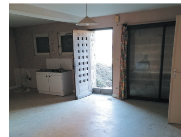
Travaux d'économie d'énergie : isolation, VMC, menuiseries...