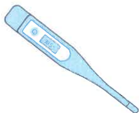
Fièvre > 38°C