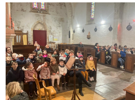
Ecole Soeur Emmanuelle de Moreilles