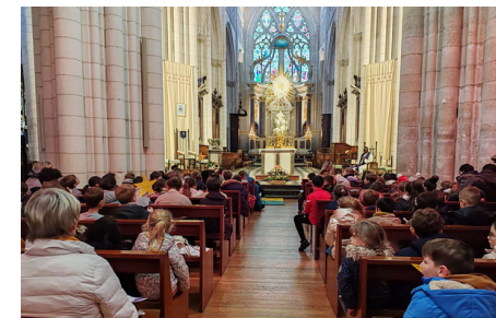
Ecole Sainte Famille de Luçon