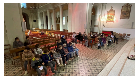
Ecole St Hilaire de l'Ile d'Elle