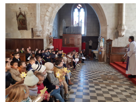
Ecole Saint Charles de Sainte Gemme