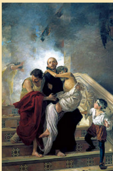
Saint Jean de Dieu sauvant les malades de l'incendie de l'hôpital royal (1880).

Seigneur, daigne exaucer notre prière pour tous les affligés et ceux qui les soignent.