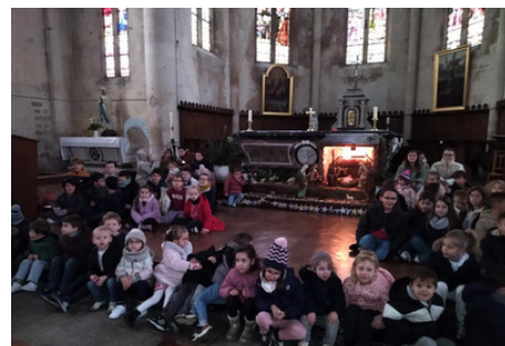
Ecole Ste Marie l'Abbaye à St Michel