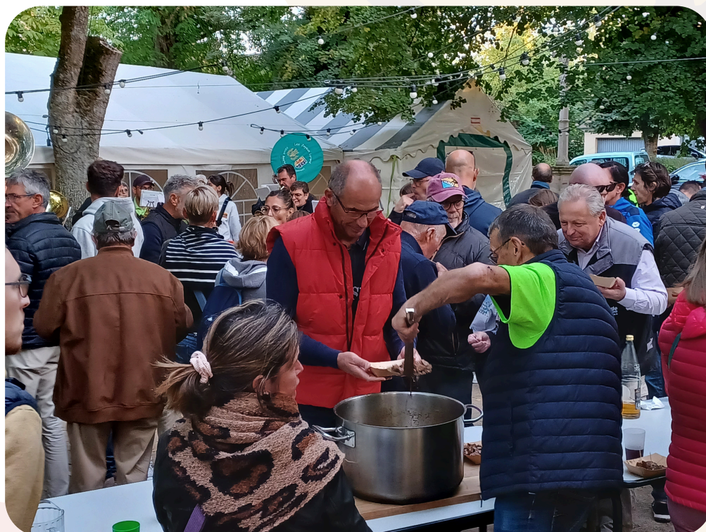
La Ronde des Châteaux

Samedi 14 septembre, la 20e édition de la Ronde des Châteaux animait une nouvelle fois Agonges.