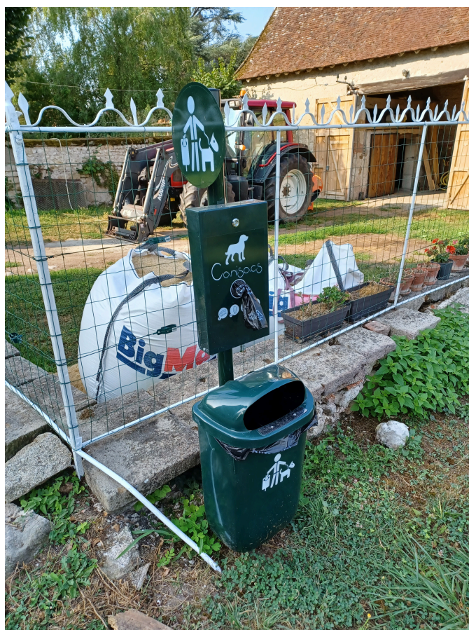
Un aperçu des Toutounettes

Pour ne pas esquiver la problématique récurrente de la propreté urbaine et afin d'offrir aux habitants un cadre de vie préservé, la commune a installé trois de ces équipements (distributeurs de sacs et poubelles). Ils se situent vers l'atelier municipal, sur la place de l'église et au carrefour de « l'ondulation ». Ils doivent être utilisés sans modération par les propriétaires de nos amis à 4 pattes.