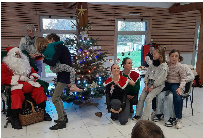
Photo de la distribution des cadeaux