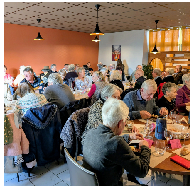
Photo du repas des aînés

Quarante et une personnes ont participé au déjeuner. Excellent repas, joie des retrouvailles, rires et partages... Ce fut un beau moment de convivialité qui a fait oublier, pendant quelques heures les petits maux liés à l'âge.