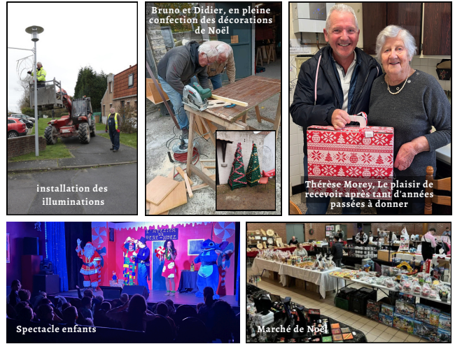
installation des illuminations

Saint-Georges a fêté la période de Noël avec joie ! Entre les superbes décorations fabriquées par nos bénévoles, le spectacle qui a été offert aux enfants de l'école par le Théâtre Les Insolites, les colis aux aînés et le marché de Noël de l'APE, l'esprit de fête était partout présent. Un immense merci à tous ceux qui ont donné de leur temps pour embellir notre village !