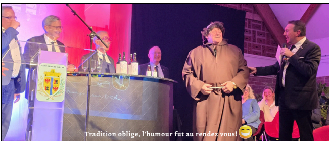
Tradition oblige, l'humour fut au rendez-vous!