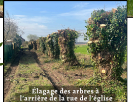
Élagage des arbres à l'arrière de la rue de l'église