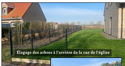
Élagage des arbres à l'arrière de la rue de l'église