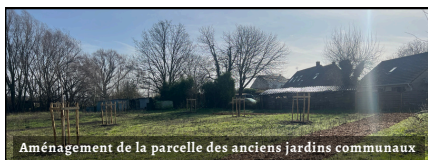
Aménagement de la parcelle des anciens jardins communaux

Le village continue de se transformer sous le ciel de Saint-Georges. Afin d'offrir un cadre toujours plus agréable aux habitants et aux visiteurs, et suite à vos demandes, des travaux d'entretien et d'embellissement en extérieur ont été réalisés ces dernières semaines.