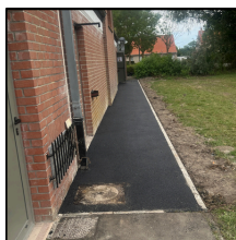
Mis en place d'un trottoir et enrobé aux abords de la salle Raymond Verva