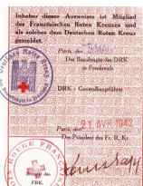
Collections du mémorial de l'Internement et de la Déportation-camp de Royallieu, 2006, 5_25_b