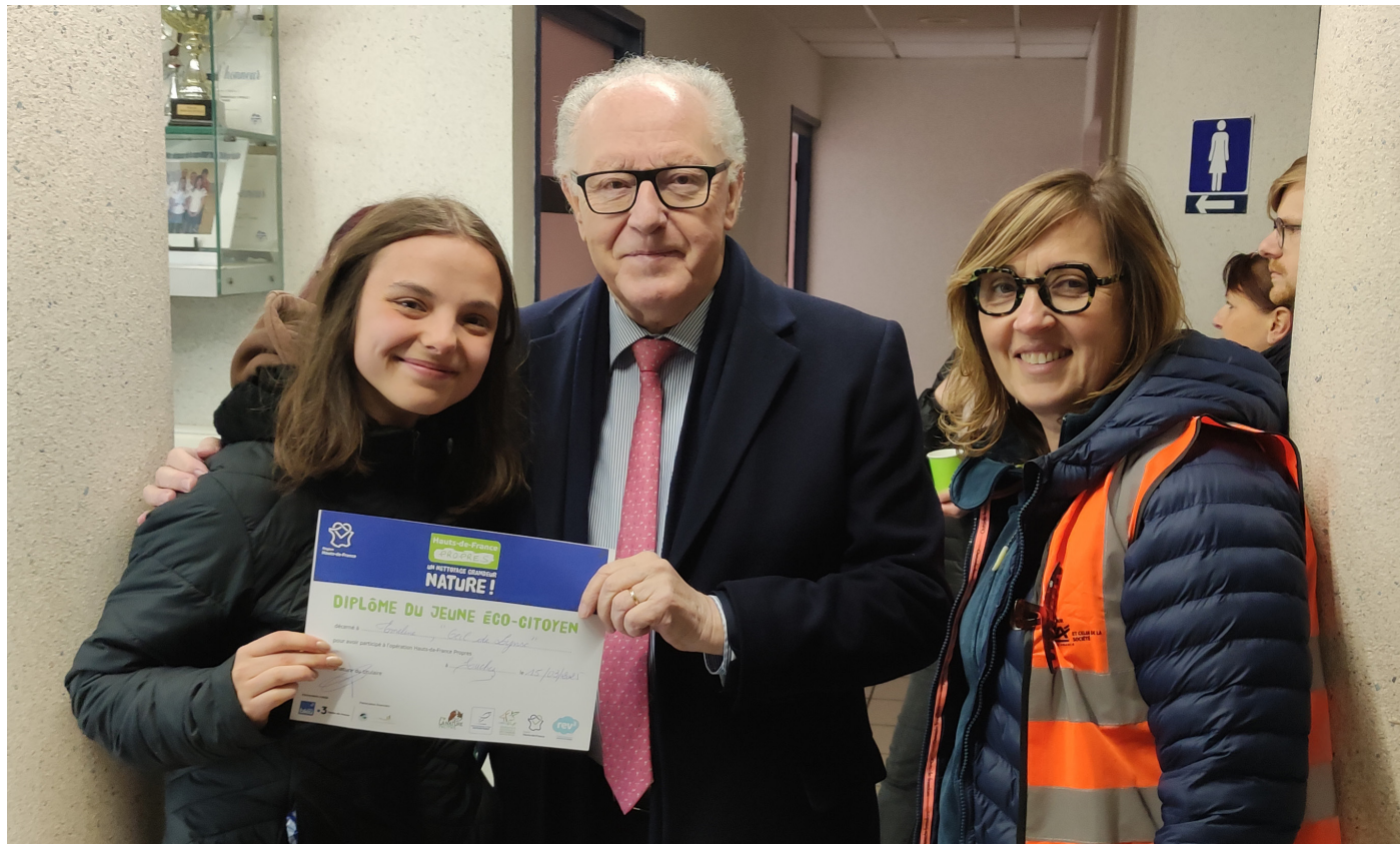
Les jeunes récompensés pour leur engagement.