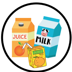
Briques en carton