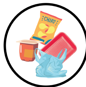
Films, barquettes, tubes, sacs...

ET TOUJOURS LE VERRE, DANS LA BORNE VERTE ET LE PAPIER DANS LA BORNE BLEUE !