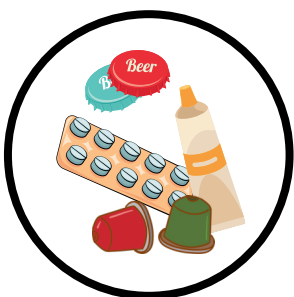
Petits emballages en métal