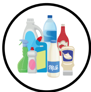
Bouteilles et flacons plastiques