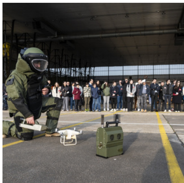
Présentation des métiers et du matériel