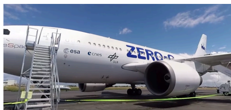
Dans la peau d'un astronaute - ARTE

Lors de votre visite, vous pouvez choisir de visionner l'un de ces trois médias :