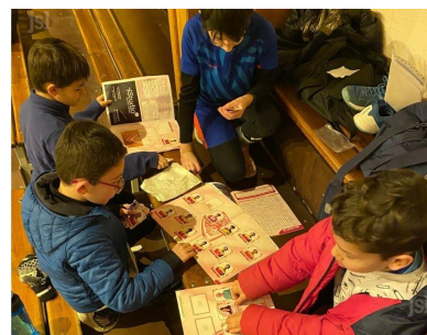
Les juniors sont très fiers d’être en vignette.

À Chauffailles, on peut se procurer ces vignettes à la librairie du coin (où il est aussi possible d’échanger les doublons) ainsi qu’Au Petit Caveau et chez Sport 2000. ■