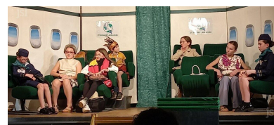
Le voyage en avion s'est bien passé.

Harmonie ; samedi 7 février et dimanche 8 (mêmes horaires), Espace du Brionnais de Chauffailles, au profit de la Ligue contre le cancer (billetterie à l'OT) ; Théâtre St-Philibert : vendredi 20 février pour les pompiers de Charlieu, samedi 21 (20 h 30) pour la Scène Hic, dimanche 22 (14 h 30) pour le Don du Sang, Charlieu ; vendredi 27 février pour l'APEL Ste Marie ; samedi 28, pour la troupe Scène Hic, dimanche 1er mars, pour l'asso Les Cigales (mêmes horaires) ; vendredi 8 mars, pour la gym de Charlieu, samedi 7, pour Scène Hic, dimanche 8, pour l'asso des scléroses en plaques du Brionnais. ■