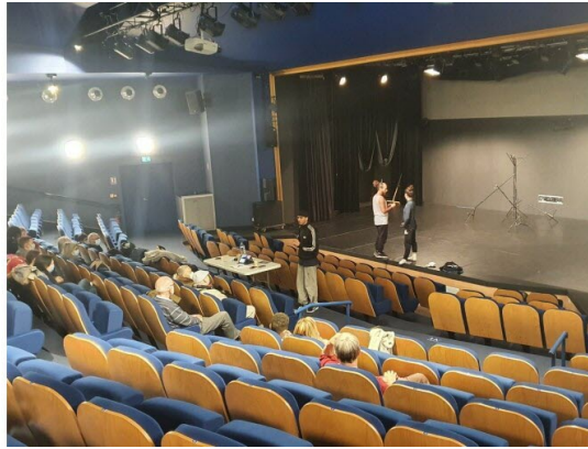
Une répétition en public pour découvrir les coulisses de la préparation des artistes.