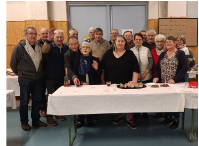
Les organisateurs du tarot de la St Valentin. Photo J. M. Collet Les organisateurs du tarot de la St-Valentin. Photo J. M. Collet