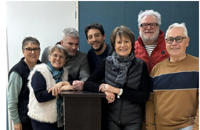
Les réservations sont ouvertes pour les représentations.

Dates à retenir : les 20, 21, 28 février et 7 mars à 20 h 30. Dimanche 22 février, 1er et 8 mars à 15 heures. Le dernier week-end, la compagnie jouera au profit de l'association « Les Colibris » de l'Ehpad de Coublanc (participation sur les entrées + buvette). ■