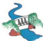
Gestion d'ouvrages hydrauliques*