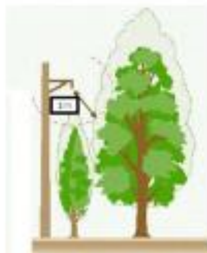
Schéma HTA & BTA