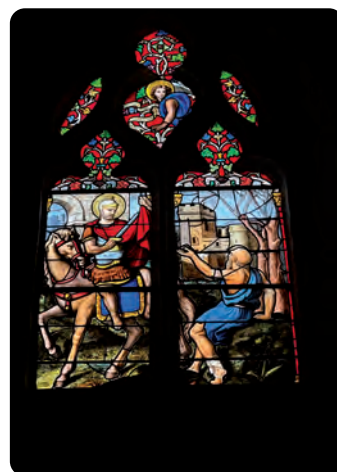
Neuvy-en-Dunois a bénéficié d'une aide à la restauration de son église, et de ses vitraux.

La plus grosse enveloppe va à Bonneval (54 256 euros) afin d'isoler la mairie et le siège de la Communauté de communes, et la moins importante à Montharville pour des travaux de restauration du petit patrimoine (3 147 euros).