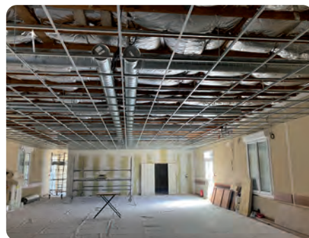
À Bouville, c'est la transformation de la salle polyvalente qui est soutenue par le fonds de concours.