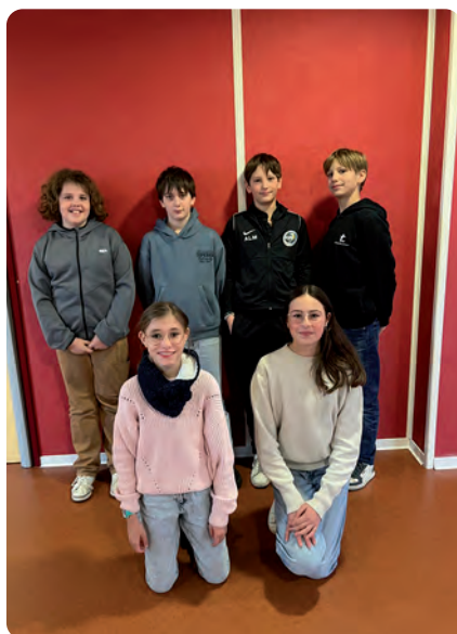
Les élus du Conseil communautaire Jeunesse planchent déjà sur quelques beaux projets

➔ Infos + ☎ 07 62 55 48 79 ✉ jeunesse@cdcbonnevalais.fr