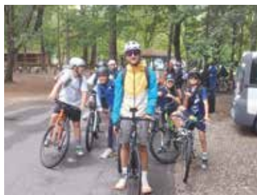
Séjour vélo jeunesse.