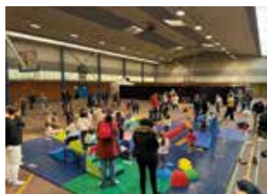
Journée de la petite enfance.

L'ensemble des services à la population vous propose des événements tout au long de l'année ! L'occasion de se découvrir, de partager dans la convivialité et la bonne humeur !