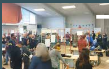
Jeudi 4 décembre Latresne Forum de l'emploi à Latresne.