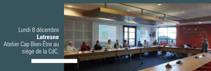
Lundi 8 décembre Latresne Atelier Cap Bien-Être au siège de la CdC.