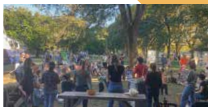
Journée des familles.