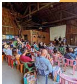
Ciné plein air organisé par le staff jeunes.