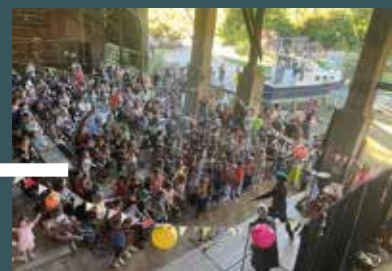
samedi 11 octobre Le Tourne Journée des familles aux Chantiers de Tramasset