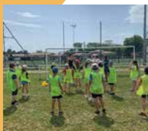
Fête des écoles multisports.