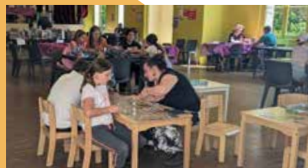
Fête de la ludothèque.