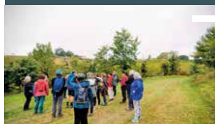
Samedi 4 octobre Hauts de Langoiran Nos Belles Balades (ainsi que le mercredi 8 octobre de Cénac à Carignan)