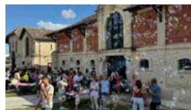
Fête du Relais Petite Enfance.