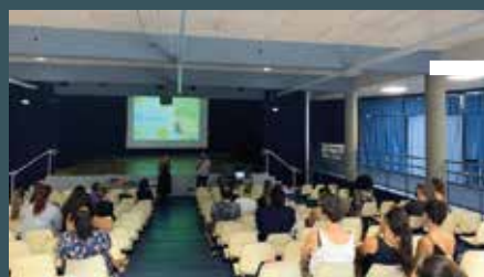
vendredi 19 septembre Latresne Conférence sur la gestion des émotions au collège de Latresne