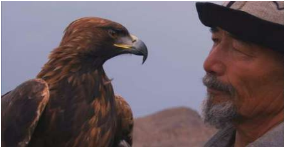
ALIK LE KAZAKH ET VIK SON AIGLE © EXTRAIT DU FILM «O'GENGIS»

Séance en présence du réalisateur Questions et échanges après la projection SAMEDI 14 FÉVRIER - 20H CINÉMA LE CHARDON