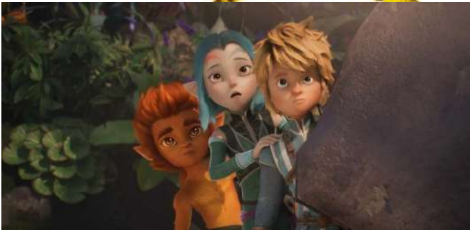
LES LÉGENDAIRES