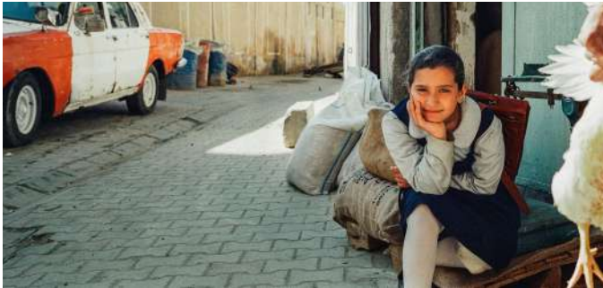
LE GÂTEAU DU PRÉSIDENT