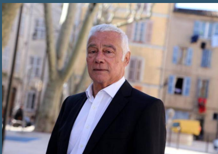
Le Maire de Forcalqueiret

En de telles circonstances, vigilance et entraide sont nécessaires et salvatrices.