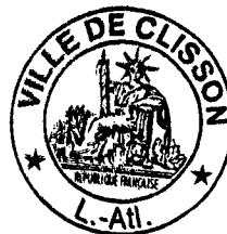
Laurence Luneau Maire

N.B. - Pour valoir 'Note de synthèse', l'ensemble des projets des délibérations est transmis, par voie électronique, à l'adresse personnelle de chacun des Conseillers municipaux.