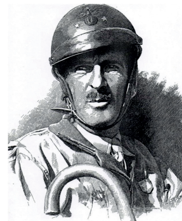
Le Général LECLERC

* Plateau : remorque plate sans ridelles