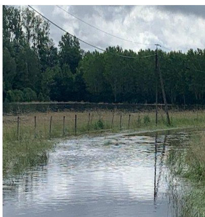
La route entre Gouërs et La Prée