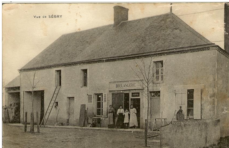
Années 30, la boulangerie exhibe fièrement son enseigne. Deux tilleuls viennent d'être plantés devant la façade...