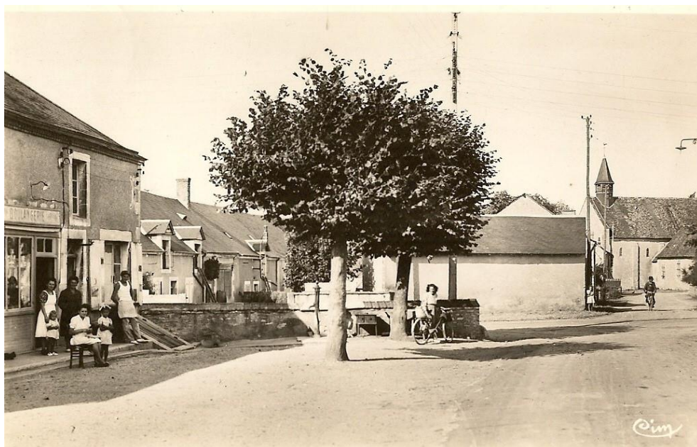
La boulangerie dans les années 50. ...les tilleuls ont fière allure !