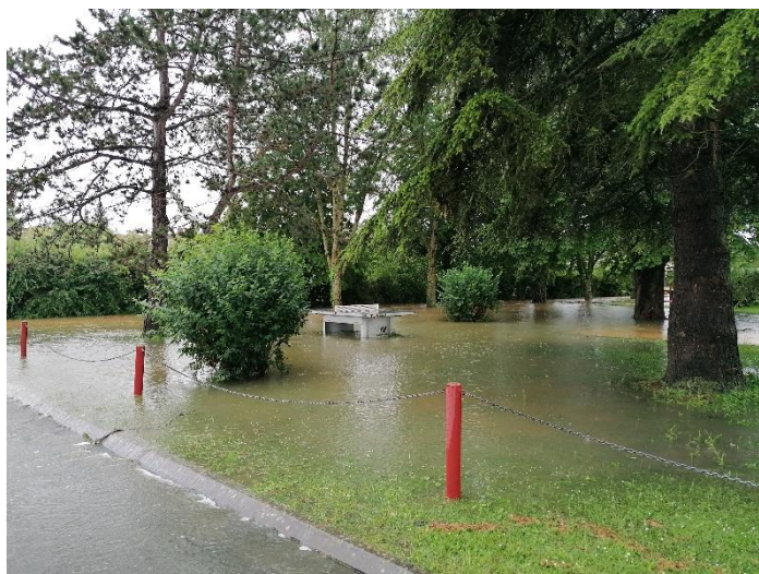
La place du village

Heureusement, personne n'a été blessé et les eaux se sont retirées. Reste des moissons fort contrariées, les engins s'embourbant dans les champs saturés d'eau et piquetés de mares.