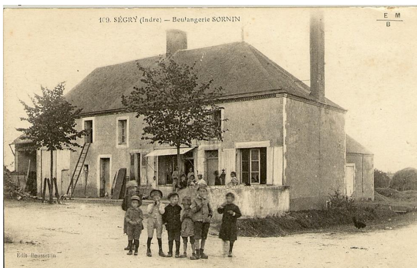
La boulangerie était le seul lieu où les enfants trouvaient confiseries et gâteaux dans les années 40/50. ... les tilleuls ont grandi !