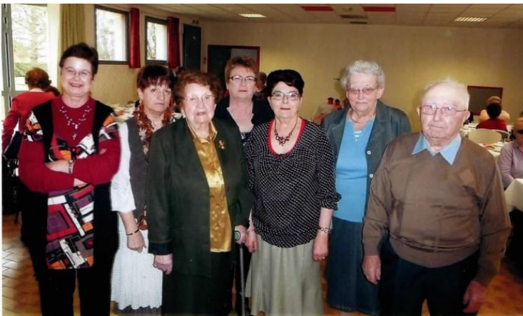
Il y a 50 ans...

1978 c'est le Club « Joie de Vivre » qui a débuté ses activités à la salle de réunion de Ségry. Ce club a traversé toutes ces années et il rassemble encore de nos jours une bonne vingtaine de personnes.