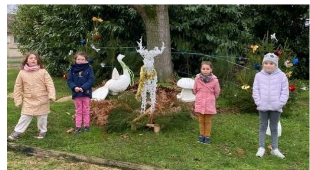
Merci aux enfants toujours partant pour décorer les sapins !