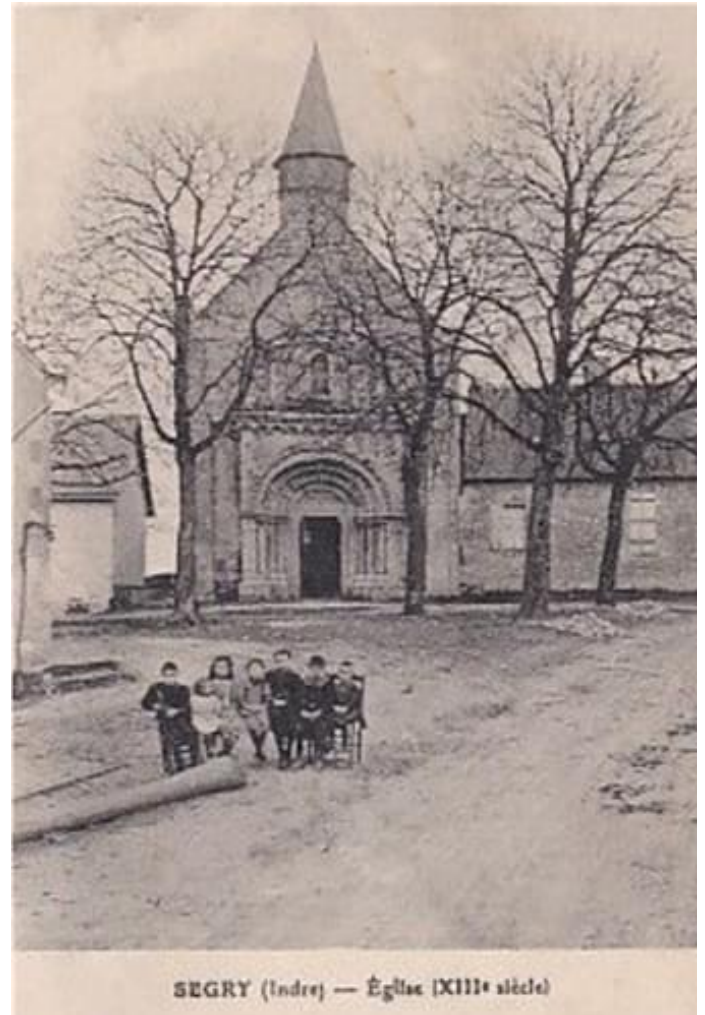
SEGRY (Indre) — Église (XIII e siècle)

Le Maire et le conseil municipal vous présentent leurs meilleurs vœux pour l'année 2024 . Qu'elle vous apporte une bonne santé, la joie au sein de vos familles, l'épanouissement dans vos projets personnels et la réussite dans vos projets professionnels.