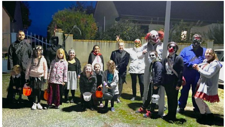
Les fêtes ont commencé fin octobre avec Halloween que les enfants de Ségry ont Fêté avec enthousiasme et bonne humeur