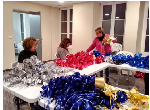
Confection de nœuds multicolores pour décorer les sapins placés dans les rues de notre village