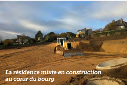
La résidence mixte en construction au cœur du bourg