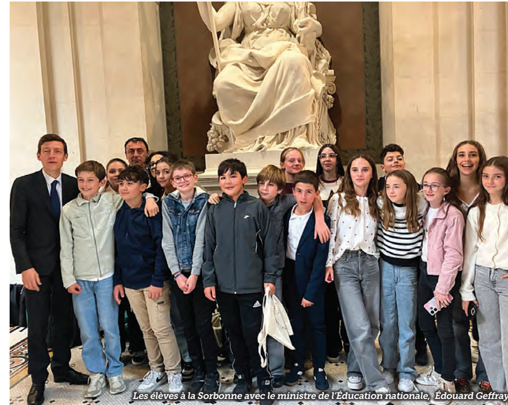
Les élèves à la Sorbonne avec le ministre de l'Éducation nationale, Édouard Geffray

172 élèves ont fait leur rentrée le lundi 1 er et mardi 2 septembre 2025 au collège Amédée Bisch. 40 sixièmes, 50 cinquièmes, 46 quatrièmes et 36 troisièmes arpentent les couloirs de l'établissement.