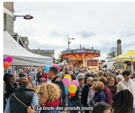
La foule des grands jours