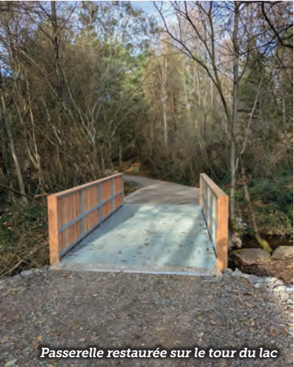
Passerelle restaurée sur le tour du lac

Durant l'automne, les trois passerelles du parcours autour des berges de l'étang ont été restaurées. Comme prévu, des travaux de réhabilitation de grande ampleur concernent actuellement le restaurant de la plage La Castanha. Ils sont nécessaires à la mise aux normes et à l'amélioration du site.