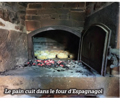
Le pain cuit dans le four d'Espagnagol

Le dimanche 3 août l'amicale d'Espagnagol a organisé avec succès sa traditionnelle fête du pain autour du four du village. La journée a été rythmée par un repas, un vide grenier et la vente de pain cuit sur place.