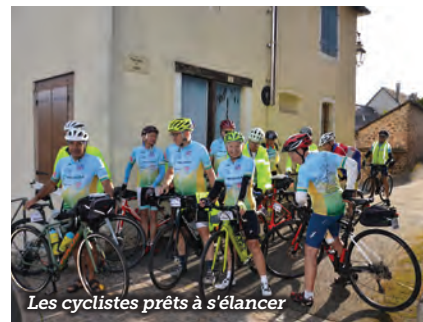
Les cyclistes prêts à s'élancer

Vous pouvez revivre le périple de ces cyclistes sur la page Facebook « Label de Cadix ».