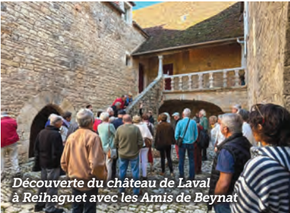
Découverte du château de Laval à Reihaguet avec les Amis de Beynat

L'été à Beynat ce fut aussi des stages de Qi gong, une exposition de l'artiste Plumazul au musée du cabas, un tournoi