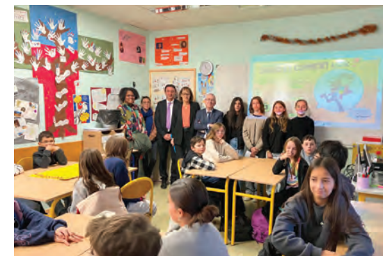
Visite de la rectrice et du DASEN à l'occasion de la journée de lutte contre le harcèlement