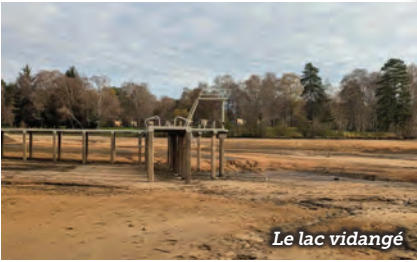
Le lac vidangé

Le plan d'eau de Miel restera vide jusqu'au mois de mars afin de permettre la minéralisation des boues, indispensable pour améliorer la qualité de l'eau, tant pour la baignade que pour la vie piscicole. Ces aménagements et travaux témoignent de la volonté de la commune de préserver et valoriser le site de Miel, afin qu'il demeure un espace naturel et touristique de référence.