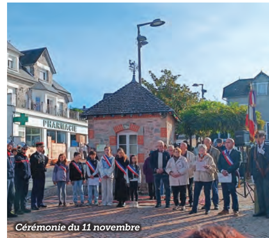
Cérémonie du 11 novembre

Cette animation consistera en une chasse aux trésors dans le bourg de Beynat avec des figurines à retrouver et à échanger contre des chocolats. Les prochains mois vont être consacrés à l'organisation de cette action avec notre médiathécaire. Une visite au musée de l'Homme de Neandertal à la Chapelle-aux-Saints, pôle culturel et patrimonial important du territoire Midi Corrézien, est prévu au mois de mars. Ils continueront par ailleurs à se rendre aux différentes cérémonies commémoratives de la commune comme ils l'ont fait le 11 novembre dernier.