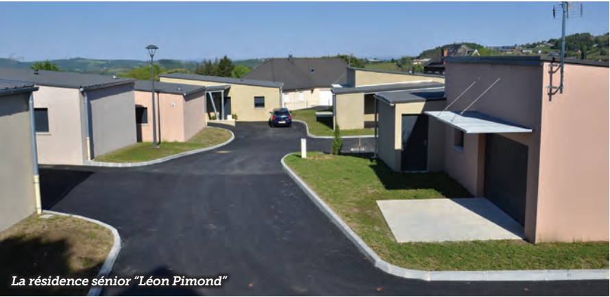
La résidence sénior "Léon Pimond"