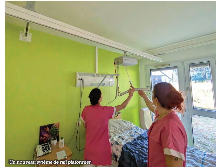
Un nouveau système de rail plafonnier