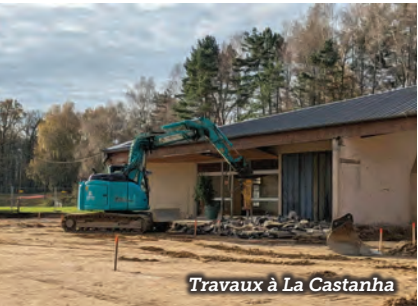
Travaux à La Castanha

Le 17 novembre, après le démantèlement des structures extérieures en bois, le terrassement a pu débuter. Le gros œuvre se fera en suivant sur le bâtiment principal. La fin des travaux est prévue pour juin 2026 avant le début de la saison estivale.