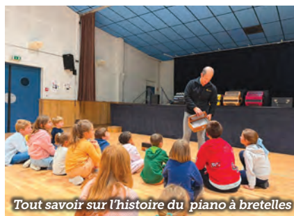
Tout savoir sur l'histoire du piano à bretelles

Pour plus d'informations et pour s'inscrire : 07 49 66 26 39 ou le 05 55 22 01 52 alshsln19@gmail.com