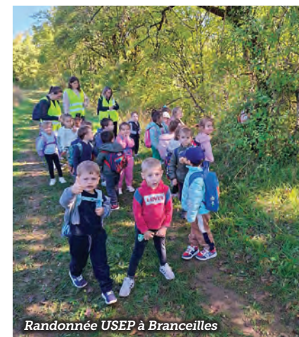
Randonnée USEP à Branceilles