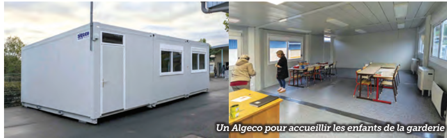
Un Algeco pour accueillir les enfants de la garderie

L'annonce de l'ouverture de cette nouvelle classe a été validée par le rectorat le jour de la rentrée. De ce fait, une salle de garderie a été aménagée en salle de classe. La mairie a fait l'acquisition de mobilier complémentaire. Pour optimiser la salle de garderie, et permettre un accueil dans de meilleures conditions, la commune a investi dans un bâtiment modulaire type algeco installé dans la cour.