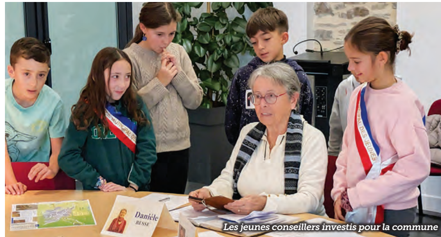
Les jeunes conseillers investis pour la commune

Le Conseil Municipal des Enfants (CME) de Beynat a repris le rythme de ses réunions mensuelles le mercredi 15 octobre 2025. Il s'agit pour cette équipe de leur deuxième et dernière année de mandat. Des projets et sorties sont déjà au programme pour les semaines à venir. Une visite est prévue à l'EHPAD le mercredi 14 janvier. Souhaitant rencontrer les résidents pour leur souhaiter la bonne année, les jeunes conseillers ont proposé, en plus des traditionnelles cartes de vœux, d'offrir une représentation mêlant chant, danse et théâtre. Cet échange intergénérationnel initié par les précédentes équipes de jeunes conseillers démontre toute la bienveillance qu'ils ont