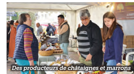
Des producteurs de châtaignes et marrons

Au sein du pôle culturel, les cabatiers et cabatières étaient à l'œuvre, tandis que les 28 auteurs régionaux invités présentaient et dédicaçaient leurs ouvrages. Le club photo de Beynat Vallée de la Dordogne a également participé avec une exposition de clichés originaux, attirant dès samedi plusieurs centaines de curieux et de passionnés dans la salle de la mairie.