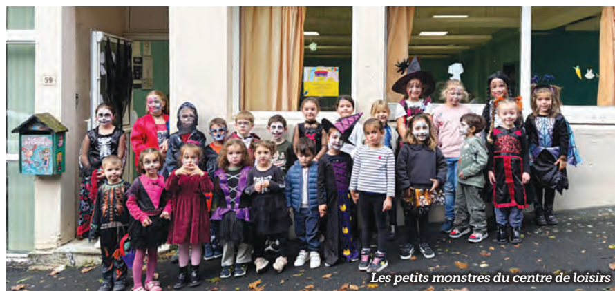
Les petits monstres du centre de loisirs

Le centre de loisirs est situé au rez-de-chaussée bas du foyer rural Pierre Demarty, 59 rue des Chalibordes. Il est géré par la communauté de communes Midi Corrézien via l'association SLN (Sport Loisirs Nature) « Vive l'Aventure ». Celui-ci accueille les enfants de 3 ans à 14 ans, les mercredis et pendant les vacances scolaires, à la journée de 7 h 20 à 18 h 40 ou à la demi-journée : de 7 h 20 à midi ou de 13 h 30 à 18 h 40.