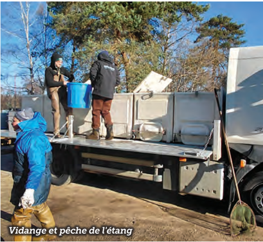
Vidange et pêche de l'étang