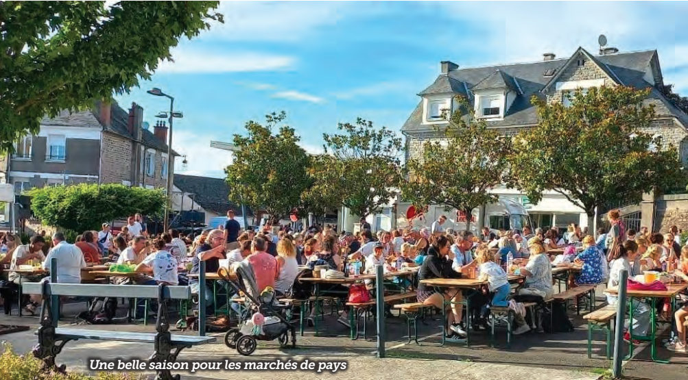
Une belle saison pour les marchés de pays

Les manifestations ont été nombreuses durant l'été 2025 à Beynat, que ce soit dans le bourg, les villages ou encore sur le site du lac de Miel.