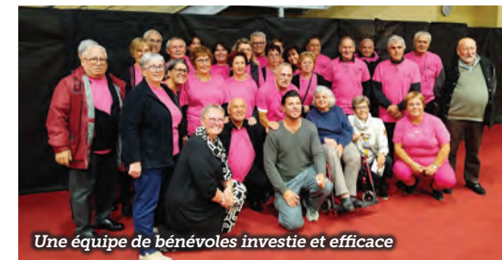
Une équipe de bénévoles investie et efficace

Enfin, l'année 2025 s'est clôturée par l'organisation d'un « vide-atelier » les dimanches et 14 et 21 décembre à la maison du département, en parallèle du marché dominical, l'occasion de pouvoir découvrir et d'acquérir des créations originales, tout en soutenant la vitalité artistique locale.