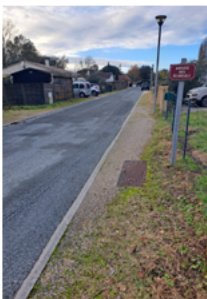
Impasse des Écureuils entièrement refaite