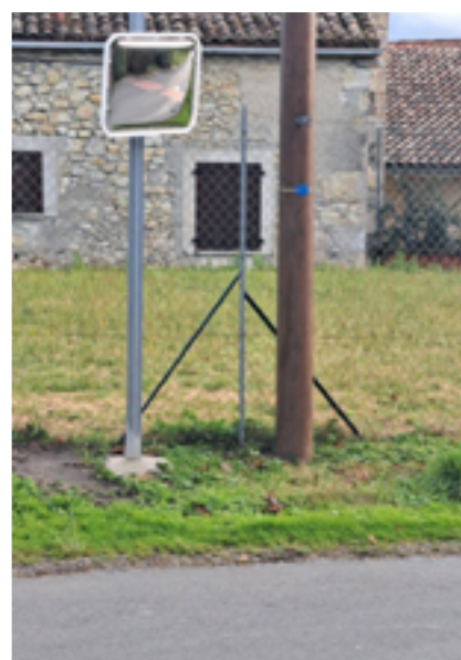
Pose de miroir de sécurité