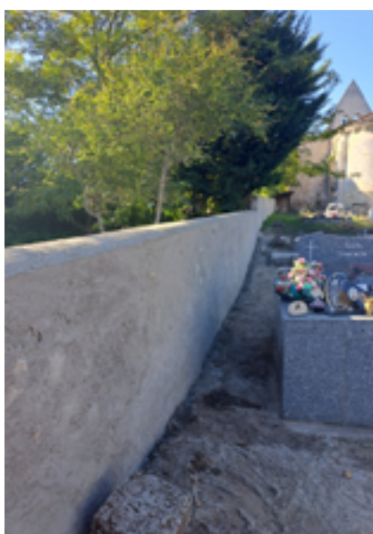
Restauration complète mur cimetière Cieuse

Des radars compteurs de vitesse ont été positionnés sur certaines portions de route afin d'envisager éventuellement de nouvelles solutions de ralentissement, notamment route de la Papeterie.