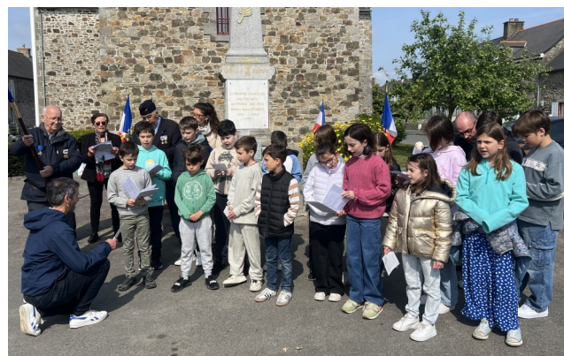
Commémoration du 8 mai avec les enfants de l'école Francis CHEVALIER

L'UNC du Vivier invite les Vivarais le 31 octobre 2025 à 11h au cimetière où une fleur sera déposée sur la tombe des anciens combattants ainsi qu'aux prochaines commémorations qui auront lieu le 11 novembre 2025 et le 5 décembre 2025 au monuments aux morts place de l'église.