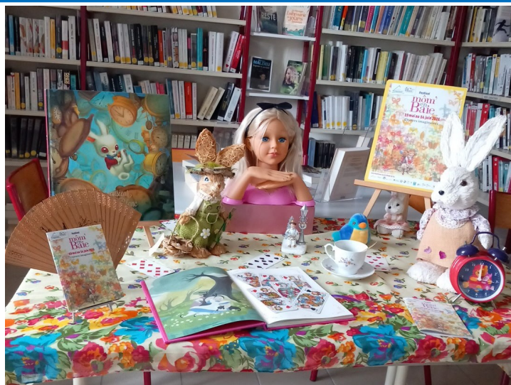
Les bénévoles de la bibliothèque ont préparé une mise en scène sur le thème de « Alice au Pays des Merveilles » à l'occasion du festival Mom' en Baie.

Site et catalogue : https://www.lire-en-baie.bzh/