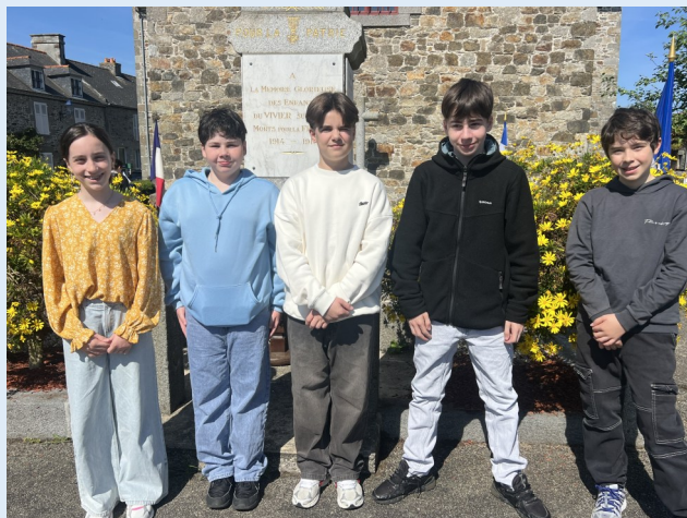
Le CMJ en partie représenté par :

Parents, n'hésitez pas à encourager vos enfants dans cette démarche citoyenne qui favorise l'autonomie et l'engagement !