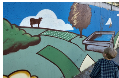
La vache dans le nuage laisse rêver !!