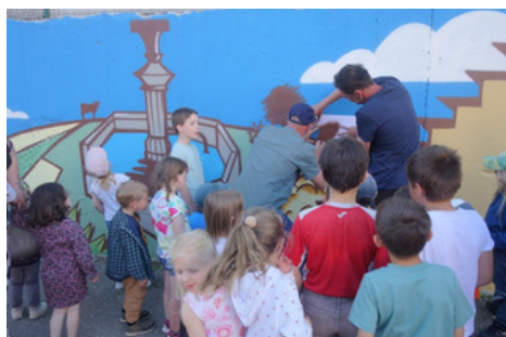
Dernière touche des artistes sous l'œil attentif des enfants pour ajouter un élément manquant dans le paysage montinois